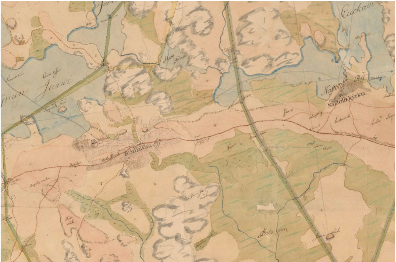
Villähde 1749- Nastolan pitäjänkartalla. Ratusäterin rakennukset ovat Vanhankartanonmäellä.

Villähteen kartanon aateliset olivat sukulaisia keskenään 1600-1700 luvulla. Esimerkiksi eversti Adan Gustav von Muhl oli naimisissa Märten Sebastian von der Trenckin tyttären kanssa.